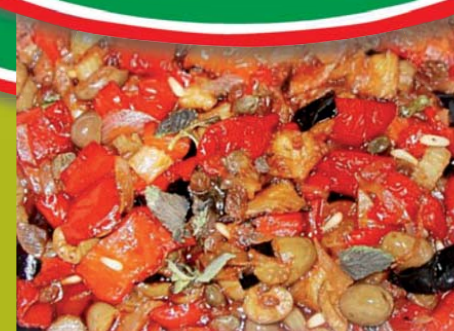
"A CAPUNATA" La Caponata